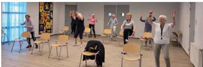
Strekken help voor de gezondheid

Bij beide groepen zijn heren natuurlijk ook van harte welkom! Dus heren, meldt u zich bij ons team aan!