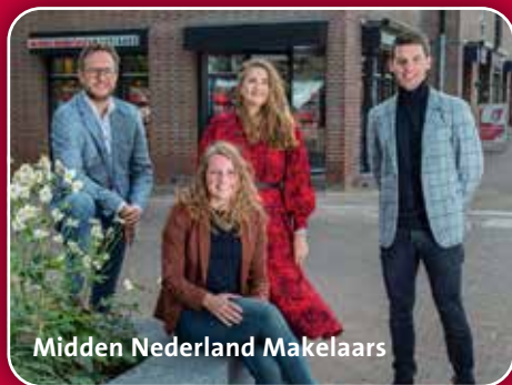
Midden Nederland Makelaars