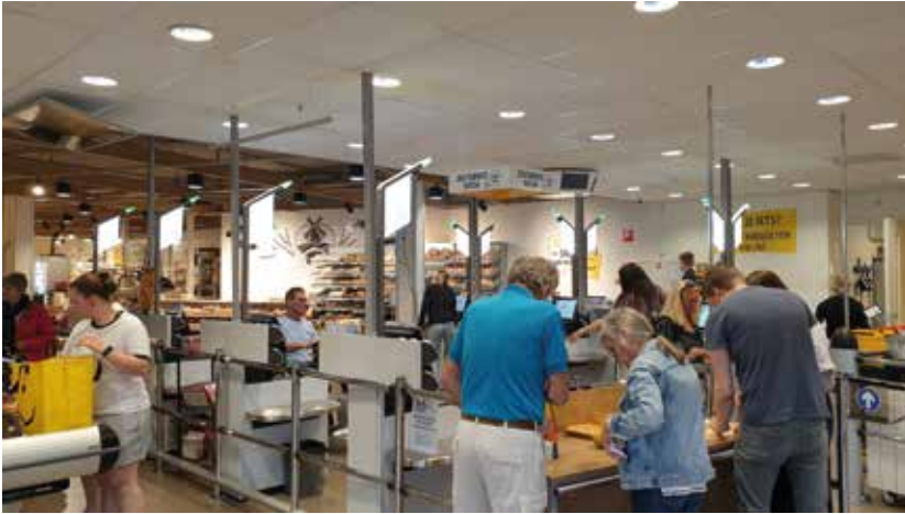
Klanten bij de kassa

geëindigd, een hele prestatie van zowel studenten als begeleiders.