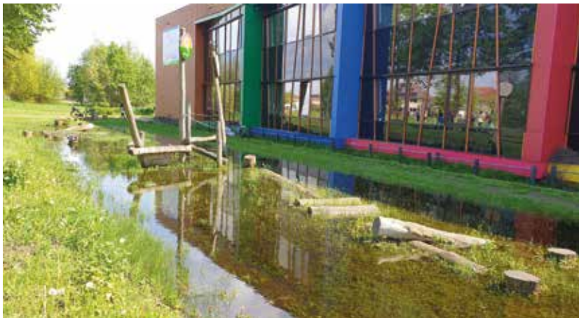
wadi bij basisschool Het Startblok

Mogelijk had u het al gelezen in de krant of op een andere manier vernomen, Waterschap Vallei en Veluwe organiseerde op 12 mei 2023 een waterwandeling in Drielanden. In de week van 12 tot en met 15 mei 2023 vond de 'Week van het water' plaats. Dit is een nationale campagne waarin waterorganisaties in heel Nederland hun waterwerk zichtbaar maken.