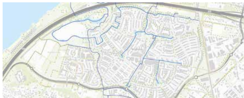
plattegrond van de wijk

Op diverse plaatsen in de wijk hebben we kwelwater gezien. Dit is grondwater wat op diverse plekken omhoogkomt. Zie ook het kaartje, waarop je kunt zien dat waterstromen spontaan beginnen.