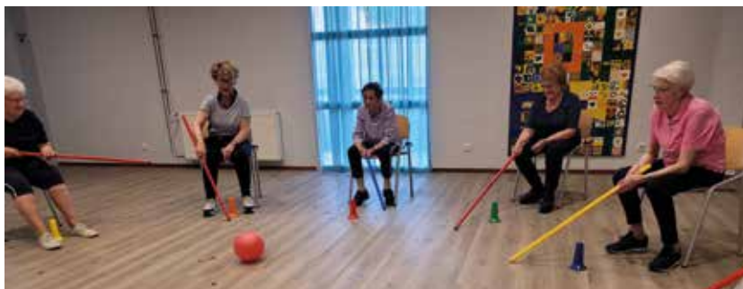
Golden Girls in beweging

Door: Lex Schuijl