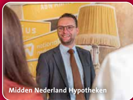
Midden Nederland Hypotheken