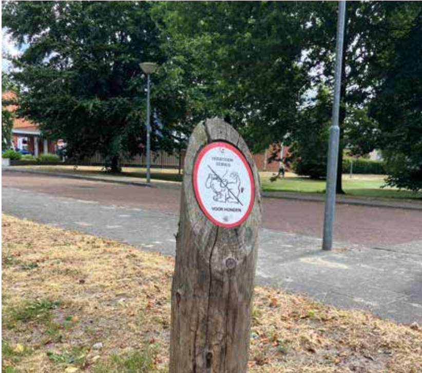
aanduiding 'verboden voor honden'

De gemeente heeft het hondenbeleid aangepast. Over 2 jaar zal de gemeente beoordelen of het nieuwe beleid werkt. Vanwege deze aanpassing hebben de hondenbezitters in maart 2023 een brief ontvangen. In de brief worden de nieuwe regels uitgelegd.