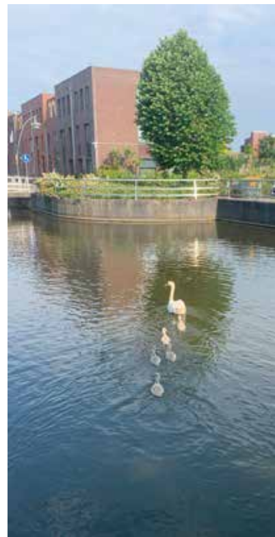
Natuur en waterbeheer in de wijk