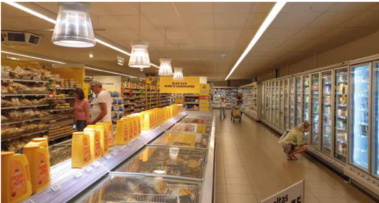
Klanten in de winkel