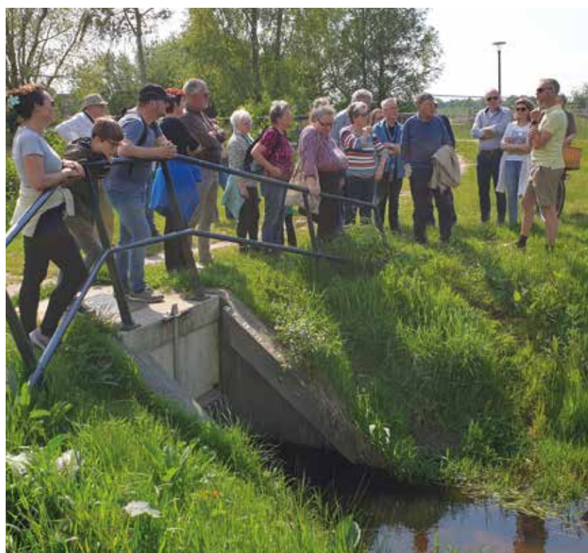
duiker voor doorloop van de Beek van de Hoge Geest

van wadi's infiltreert het water naar de ondergrond. Bij de andere wadi's loopt het water via putten naar de sloot. Tijdens de wandeling was het vochtig weer. Daardoor konden we de eerste gevulde wadi waarnemen bij basisschool Het Startblok.