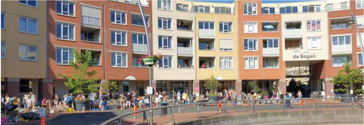
Triasplein kleedjesmarkt 2022